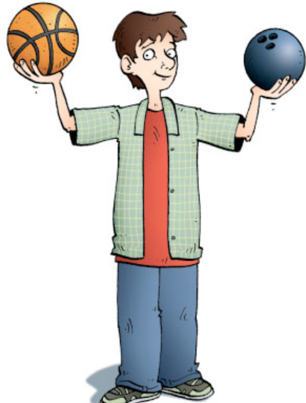
Figure 7.1 A bowling ball has more mass but less volume than a basketball.